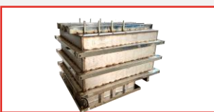
超高强度全304不锈钢长方体焊接内腔，4层焊接层，高效焊接