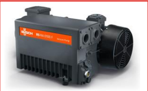
油润滑旋片式真空泵