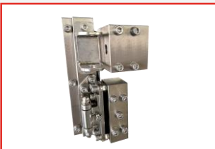
高强度门锁及精密锁止装置