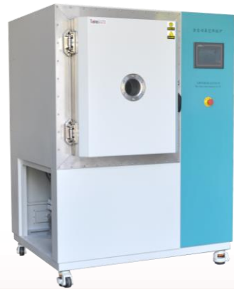
全自动热板式真空焊接炉：

用于可控硅模块、固体继电器、整流模块等电力模块器件，批量、高效、无氧化真空焊接。