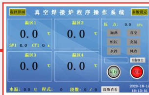
PLC智能控制，支持工艺设置